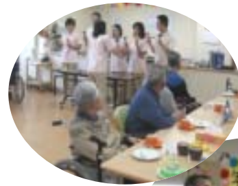
デイケアセンター 年越し会